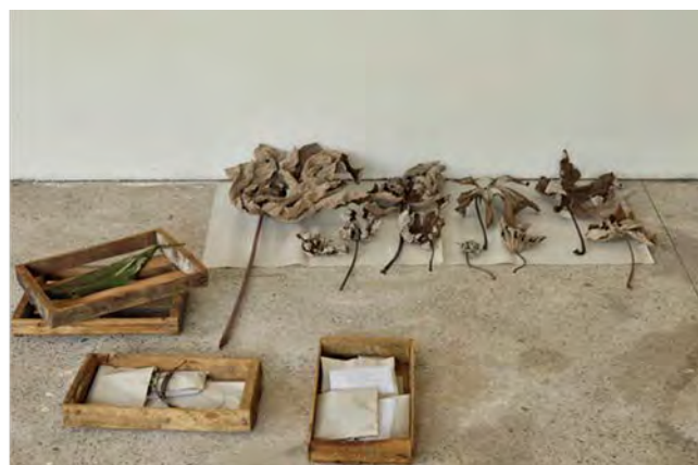
Imagem 3: Fotos de Inês Moura para a instalação Herbarium in loco (2011). Foto: Inês Moura Montagem nossa