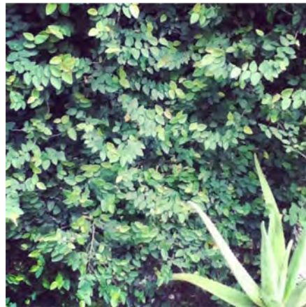
Imagem 2: Our Relationship Explained by Nature #1 , 2012 Estudos para o projeto de desenho Our Relationship Explained by Nature #2 Fotos: Inês Moura Montagem nossa