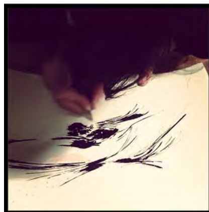
Imagem 6 - Inês Moura em desenho da série Our relationship explained by nature #2