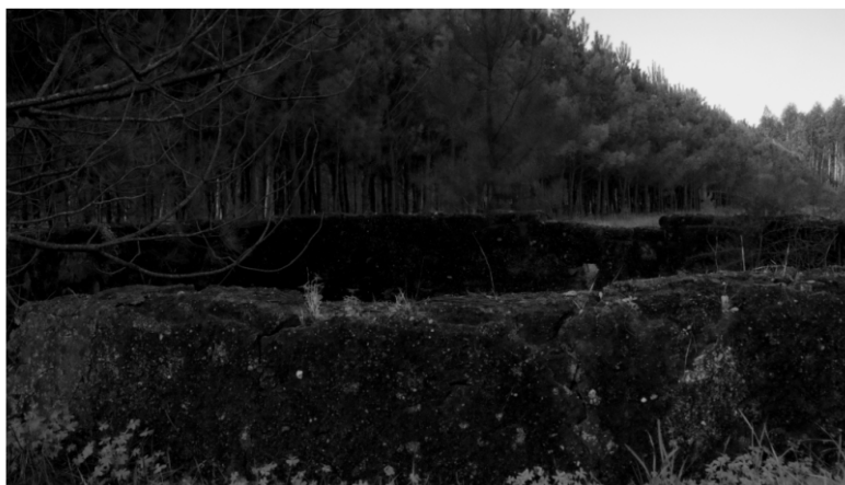
Imagem 1: Paisagens , 2012 Impressão a jato de tinta sobre papel fotográfico. 26,5 x 47 cm.