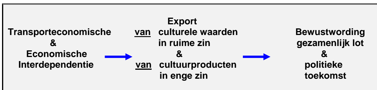
Figuur 5.1: Onderliggende dynamiek achter de integratie van de Baltische Zeeregio

"gezamenlijk lot" in de Baltische Zeeregio, en -uiteindelijk- van een "gezamenlijke politieke toekomst". Voor zover het vanuit wetenschappelijk oogpunt mogelijk is om oorzaak en gevolg in deze dynamiek enigszins uit elkaar te halen, zou men deze de evolutie in de ruimere Noordse regio als volgt kunnen voorstellen: