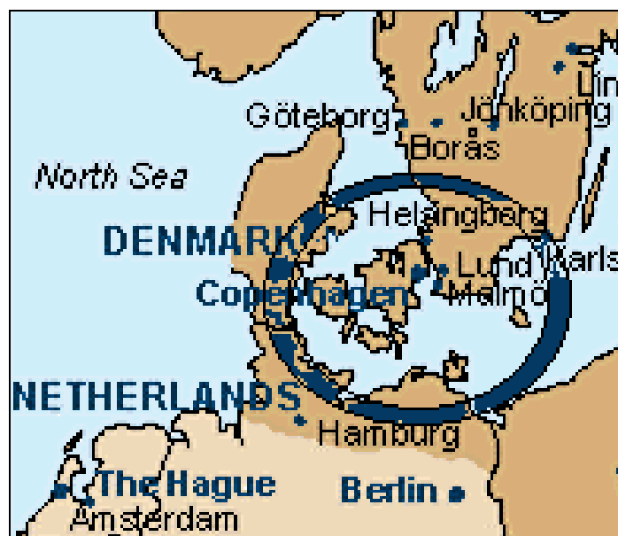
Figuur 4.1: Öresund als gateway tussen het Fenno-Scandinavisch schiereiland en het Europese vasteland

transporteconomische perspectief vormt met andere woorden een belangrijke impuls tot de vorming van nieuwe handelsnetwerken in de ruimere Noordse regio 23 .