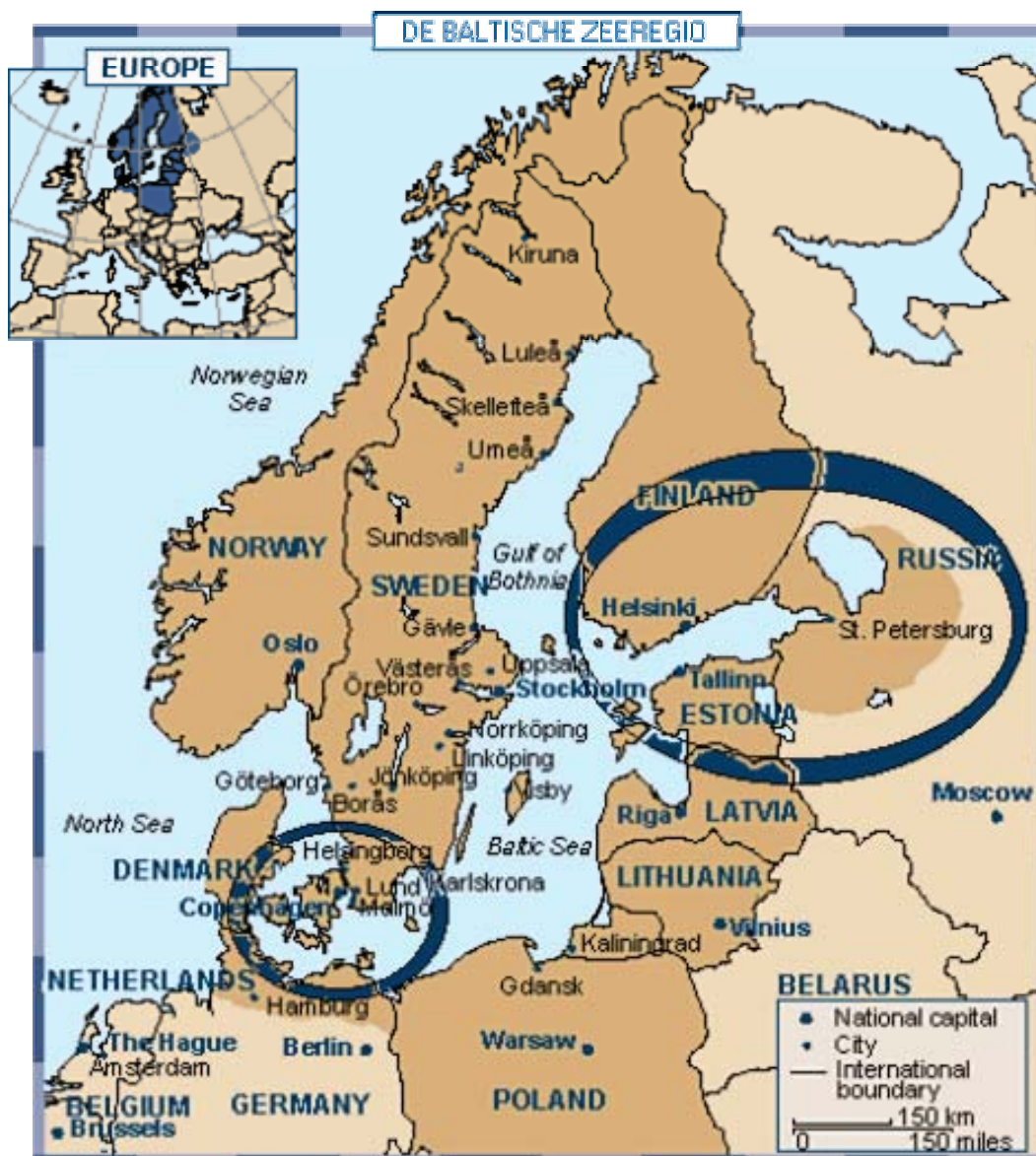
Figuur 3.1: De gebieden rond de Baltische Zee in kaart gebracht

Het rijke gemeenschappelijke verleden van deze landen vormt een inspiratiebron bij het hierboven geschetste proces. Het is evenwel onjuist dit te interpreteren als een louter romanticisme. De geschiedenis dient hier vooral als richtbaken, en als bewijs voor de reële mogelijkheid van een gemeenschappelijke, moderne Noordse toekomst. Temidden van deze geopolitieke transformatie refereert een toenemende groep beleidsfunctionarissen en economische actoren naar de middeleeuwse Hanzeperiode (zie infra) 12 . Het gaat hierbij om een referentiekader dat de landen in de Baltische Zeeregio 13 hanteren om zichzelf economisch, cultureel en politiek te heroriënteren.