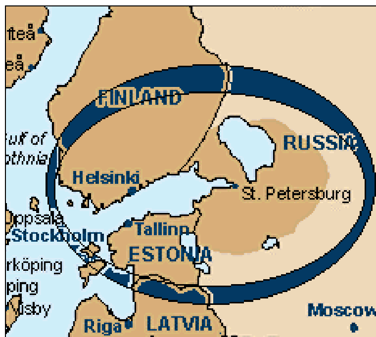
Figuur 4.2: De regio Helsinki-St.Petersburg-Novgorod-Tallinn

Ook de ruimere regio rond Helsinki in Finland vormt vandaag een erg dynamische Noordse regio. Al blijft het politieke en culturele belang van dit gebied voor Vlaanderen eerder beperkt, qua economisch potentieel is het enigszins vergelijkbaar met de Öresund. Ongeveer 21 'gemeenten' maken de kern uit van deze regio. De grootste Finse stad is Helsinki zelf (550.000 inwoners). In de ruimere agglomeratie van Helsinki woont bijna één vijfde van de totale Finse bevolking. 75 % van alle buitenlandse bedrijven is gelocaliseerd in dit uiterste zuiden van het land. Tezamen dragen ze 28 % bij tot het Finse BNP, en verschaffen zo'n 23 % van alle Finse jobs.